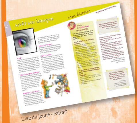
Livre du jeune - extrait