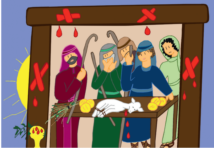
Image Ancien Testament