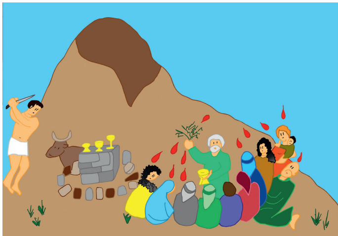
Image Ancien Testament